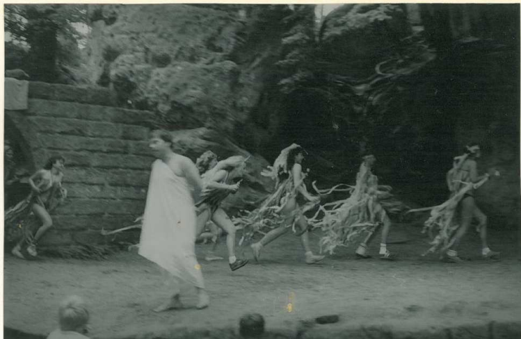
HURÁ NA SMOUČKA!