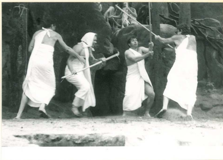
Souboje antického Říma