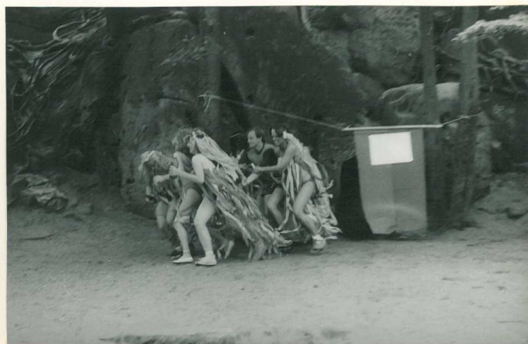
UŽ HO MÁME!