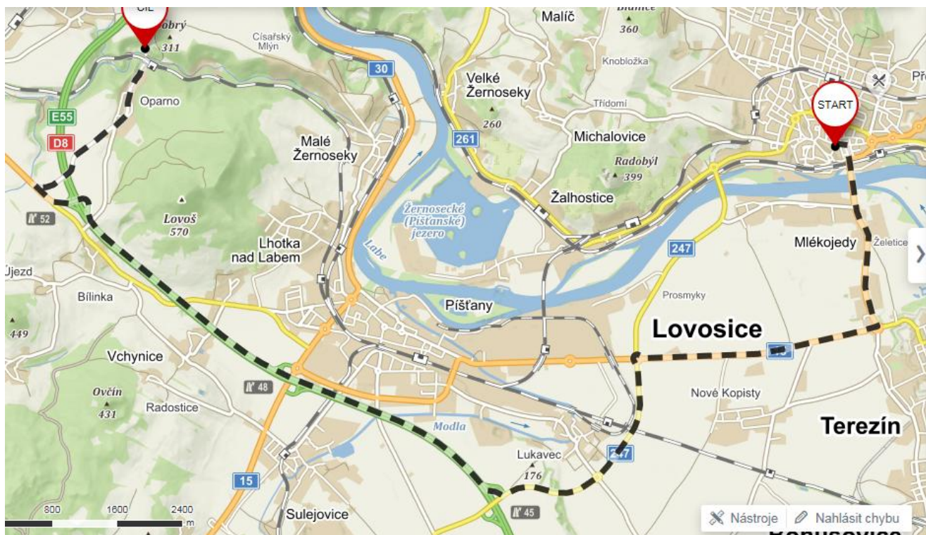
MAPA 6 – doprava autem – z Lovosic (mimo dálnici)