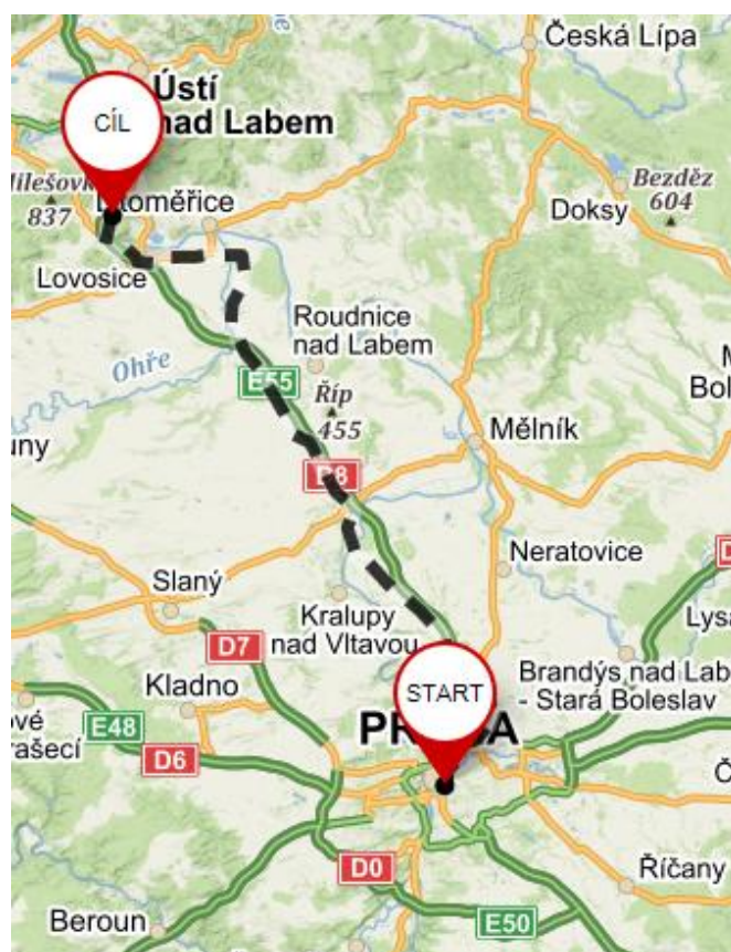
cesta po neplaceném úseku