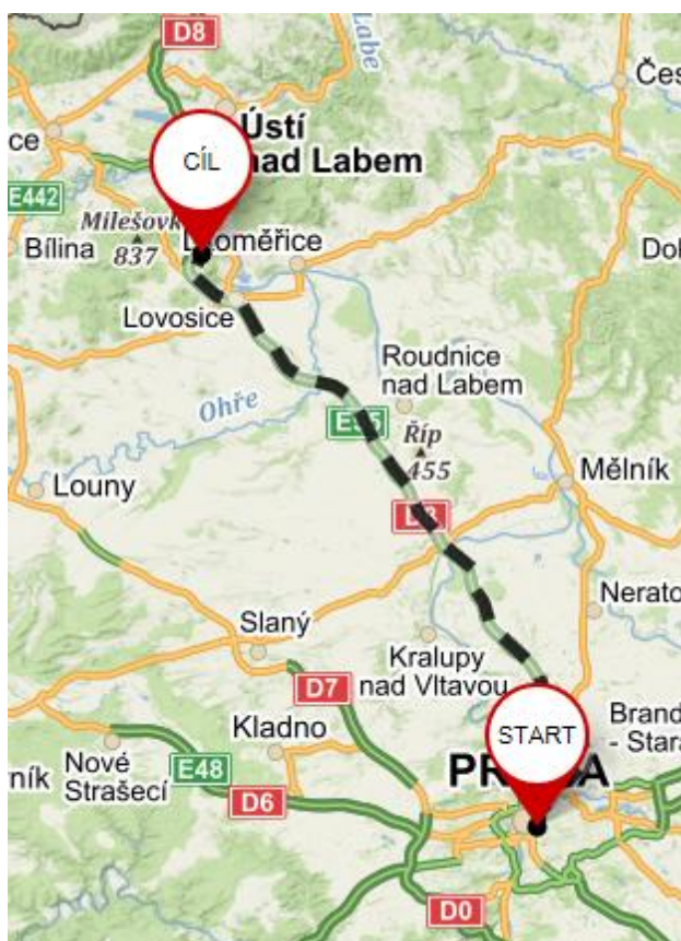
Po dálnici z dálnice D8